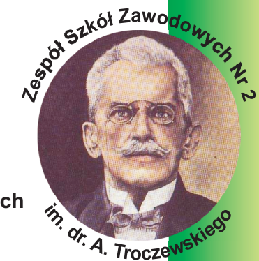
Zespół Szkół Zawodowych Nr 2 im. dr. A. Troczewskiego

www.troczewski.pl facebook.com/zsztroczewski